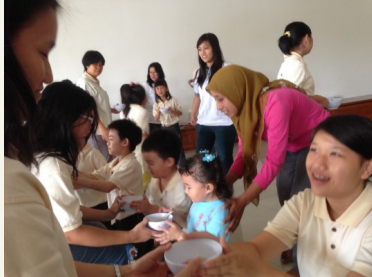
Menyuapi Orang Tua