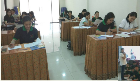
Kelas Di Zi Gui Dewasa