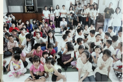
Acara Ke Panti Asuhan